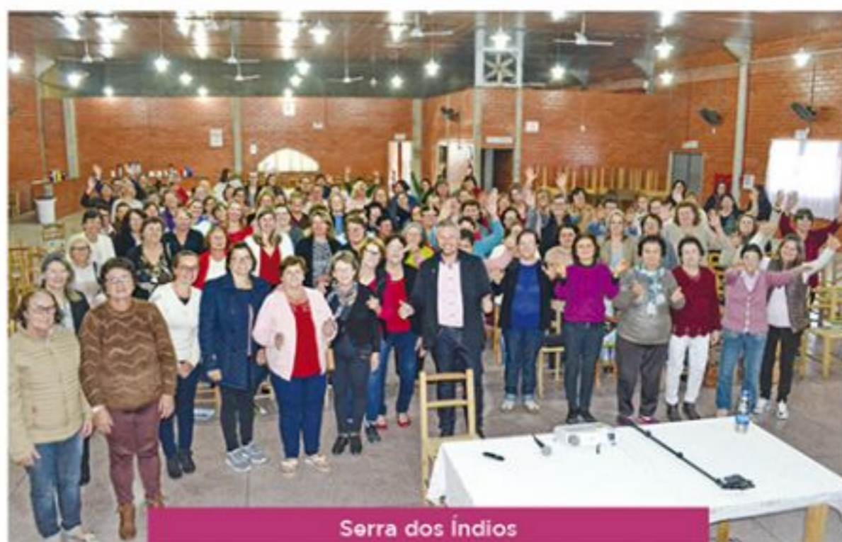
Serra dos Índios