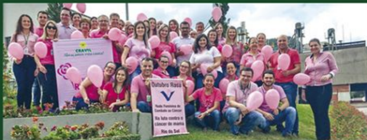
• OUTUBRO ROSA • A Cravil veste rosa em apoio a campanha Outubro Rosa da Rede Feminina de Combate ao Câncer de Rio do Sul, uma ação global de conscientização e prevenção ao câncer de mama.