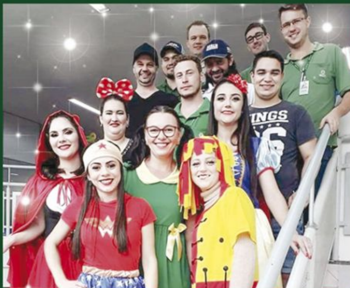
• DIA DAS CRIANÇAS • A equipe do Supermercado e Loja Agrícola Cravil de Rio do Oeste vestiu a camisa, ou melhor a fantasia, e entrou no clima de Dia das Crianças!