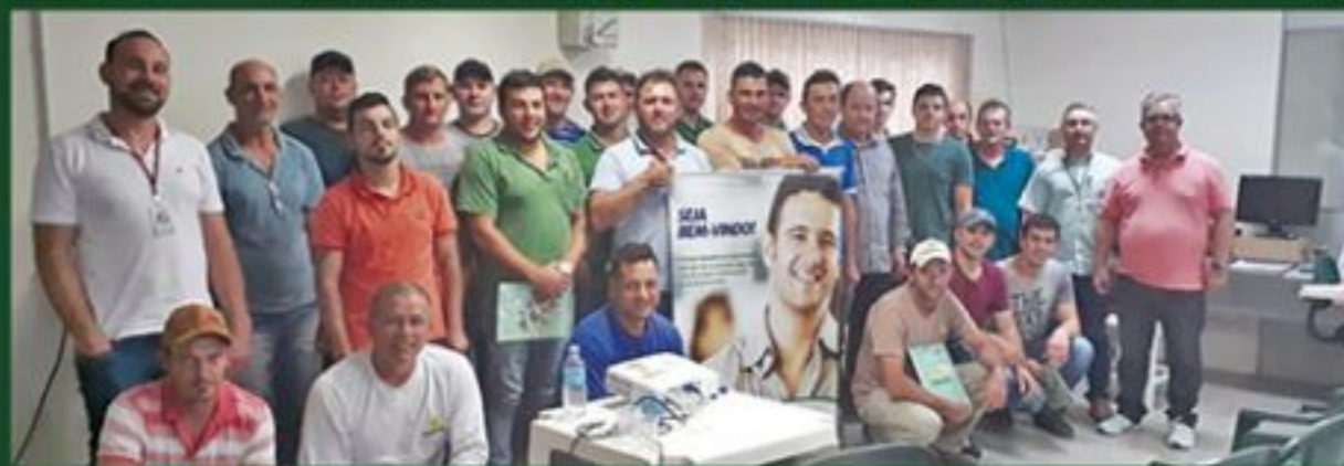
• CAPACITAÇÃO • A Cravil realizou nos dias 10 e 11 de outubro, na Sede da Cooperativa e na Indústria de Arroz em Pouso Redondo, o treinamento "Armazenagem de grãos e Segurança" com a H&C Treinamento.