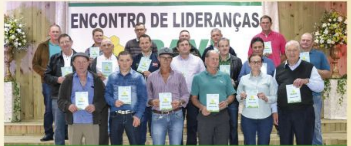
Presidente Getúlio, Serra dos Índios, Dona Emma e Witmarsum