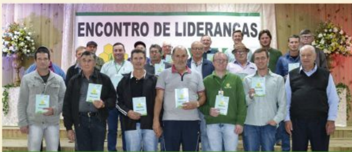
Rio do Sul, Braço do Trombudo, Lontras, Atalanta e Agronômica