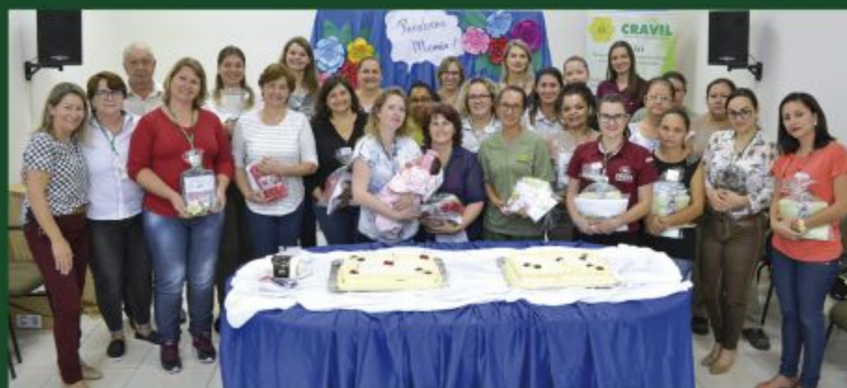
• DIA DAS MÃES • As mães da Sede da Cravil, em Rio do Sul, participaram de uma homenagem alusiva ao Dia das Mães.