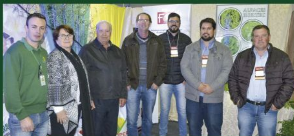
• AGRO VALE • A Cravil participou em junho da segunda edição da Expoeira Agrícola do Alto Vale, em Rio do Sul. A Cooperativa contou com a parceria da Hortec e Fecoagro.