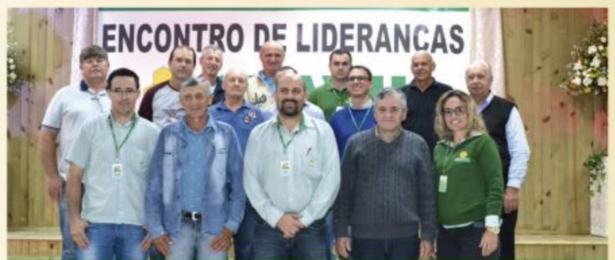
Itajaí, Gaspar, Timbó e Rio dos Cedros