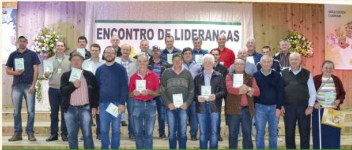
Pouso Redondo, Taió, Rio do Oeste e Toca Grande