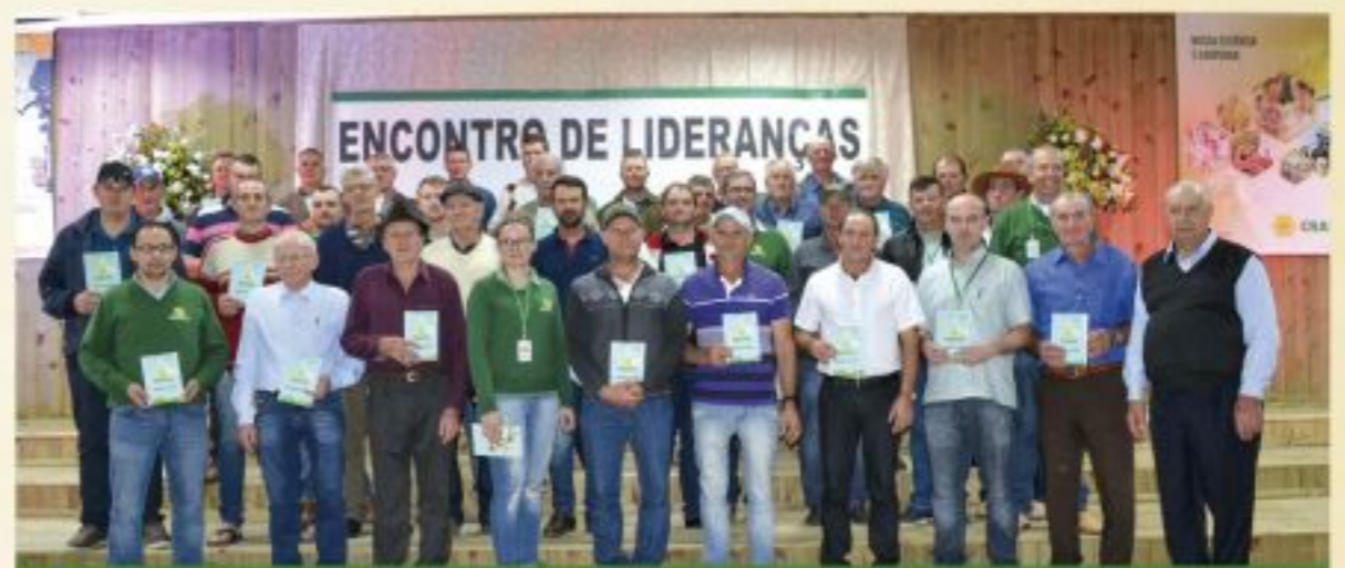
Alfredo Wagner, Bom Retiro, Imbuia, Ituporanga, Petrolândia e Vidal Ramos