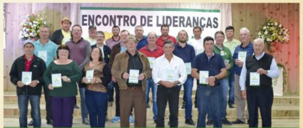
Salete e Rio do Campo