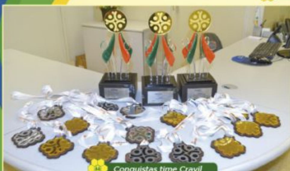
Conquistas time Cravil