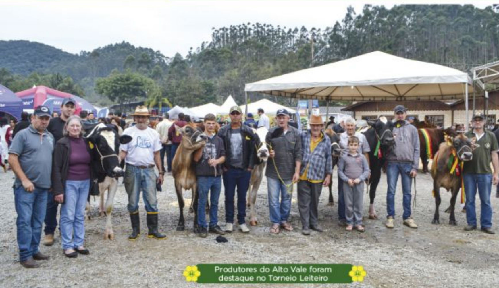
Produtores do Alto Vale foram destaque no Torneio Leiteiro