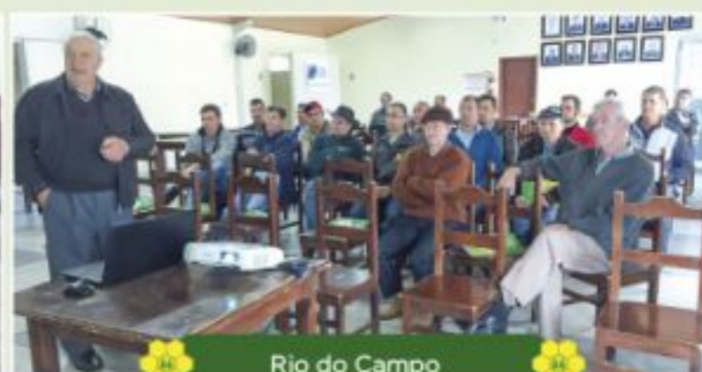
Rio do Campo