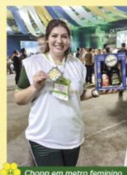
Chopp em metro feminino