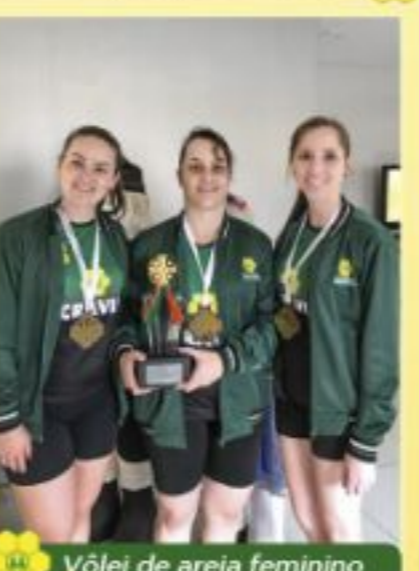
Vôlei de areia feminino