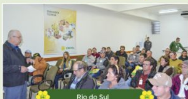
Rio do Sul