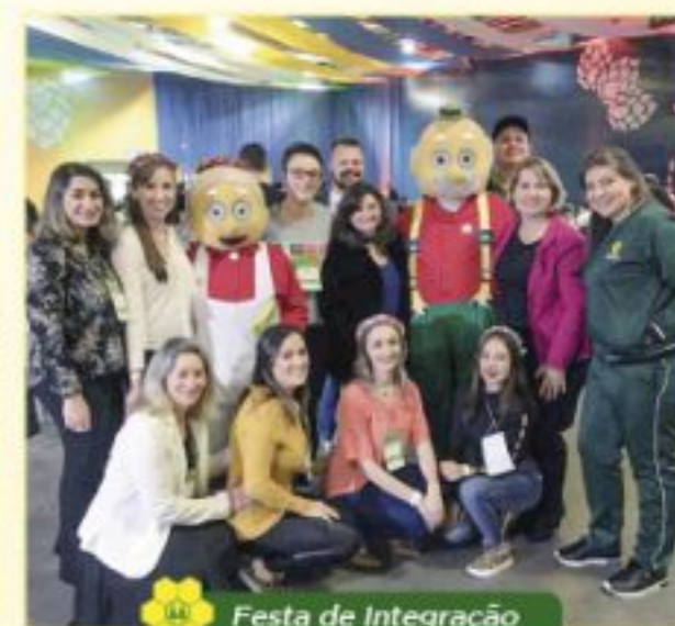
Festa de Integração