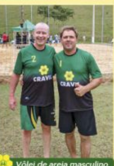
Vôlei de areia masculino