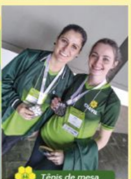
Tênis de mesa